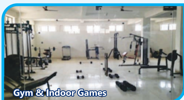
Gym & Indoor Games