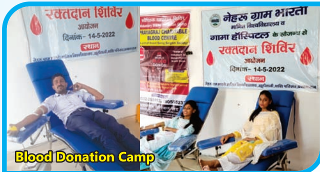
Blood Donation Camp