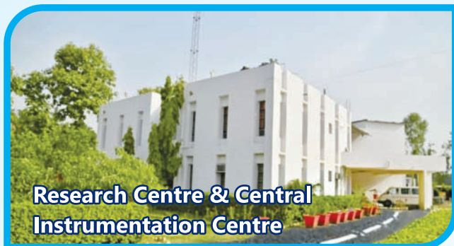
Research Centre & Central Instrumentation Centre