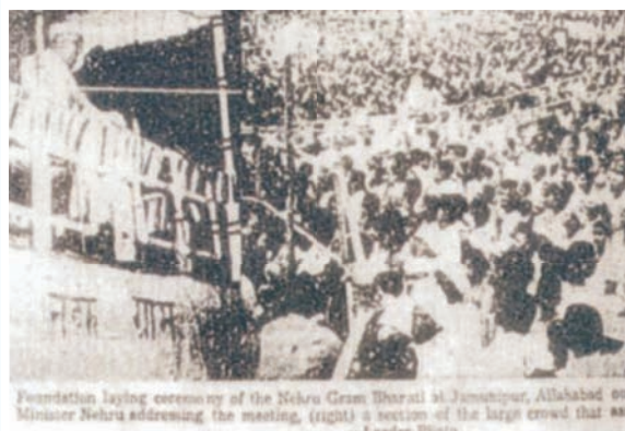
Late Pt. Jawahar Lal Nehru laying the foundation stone of Nehru Gram Bharati on 26th July, 1962

NGB (DU) is located in a rural area in co-existence with natural environment. It aims at embowering the faith of Prayagraj and nearby districts with vocational and skill development training along with opportunity of self employment and entrepreneurship.