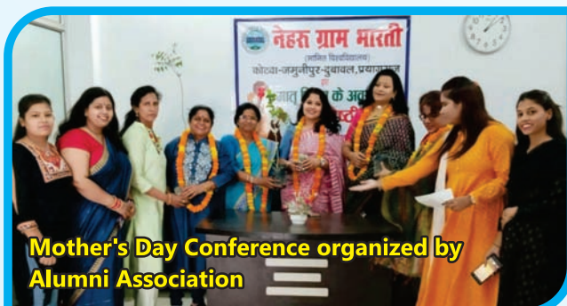
Mother's Day Conference organized by Alumni Association