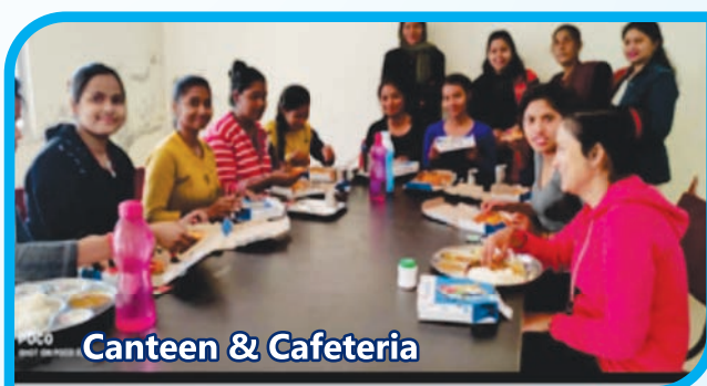
Canteen & Cafeteria