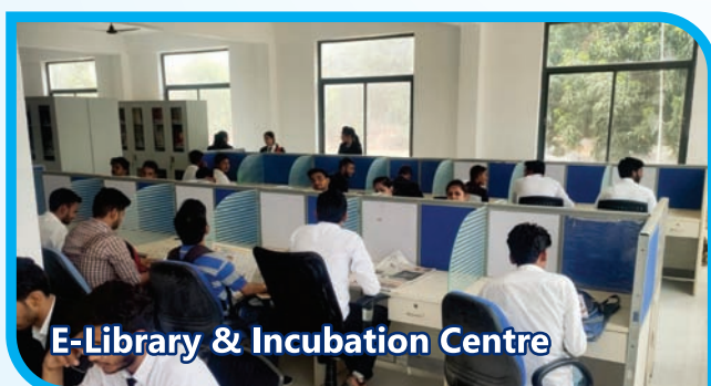
E-Library & Incubation Centre