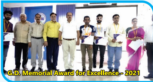
G.D. Memorial Award for Excellence - 2021