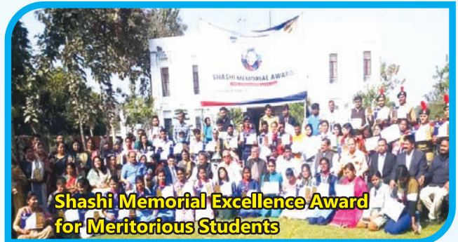
Shashi Memorial Excellence Award for Meritorious Students