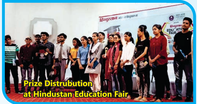
Prize Distribution at Hindustan Education Fair