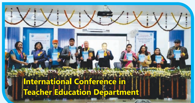
International Conference in Teacher Education Department