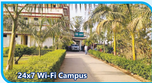
24x7 Wi-Fi Campus