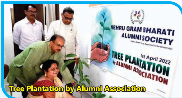
Tree Plantation by Alumni Association