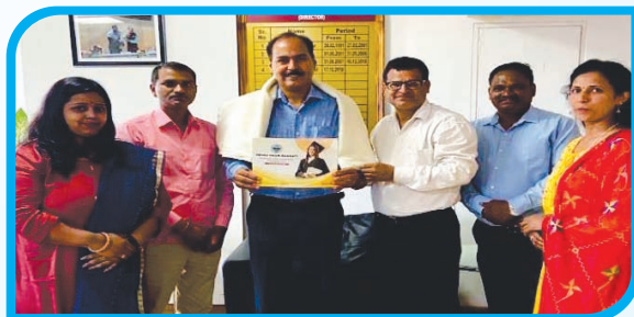
Soul 3.0 Training INFLIBNET CENTRE Gandhi Nagar, Gujarat