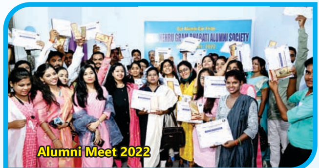
Alumni Meet 2022